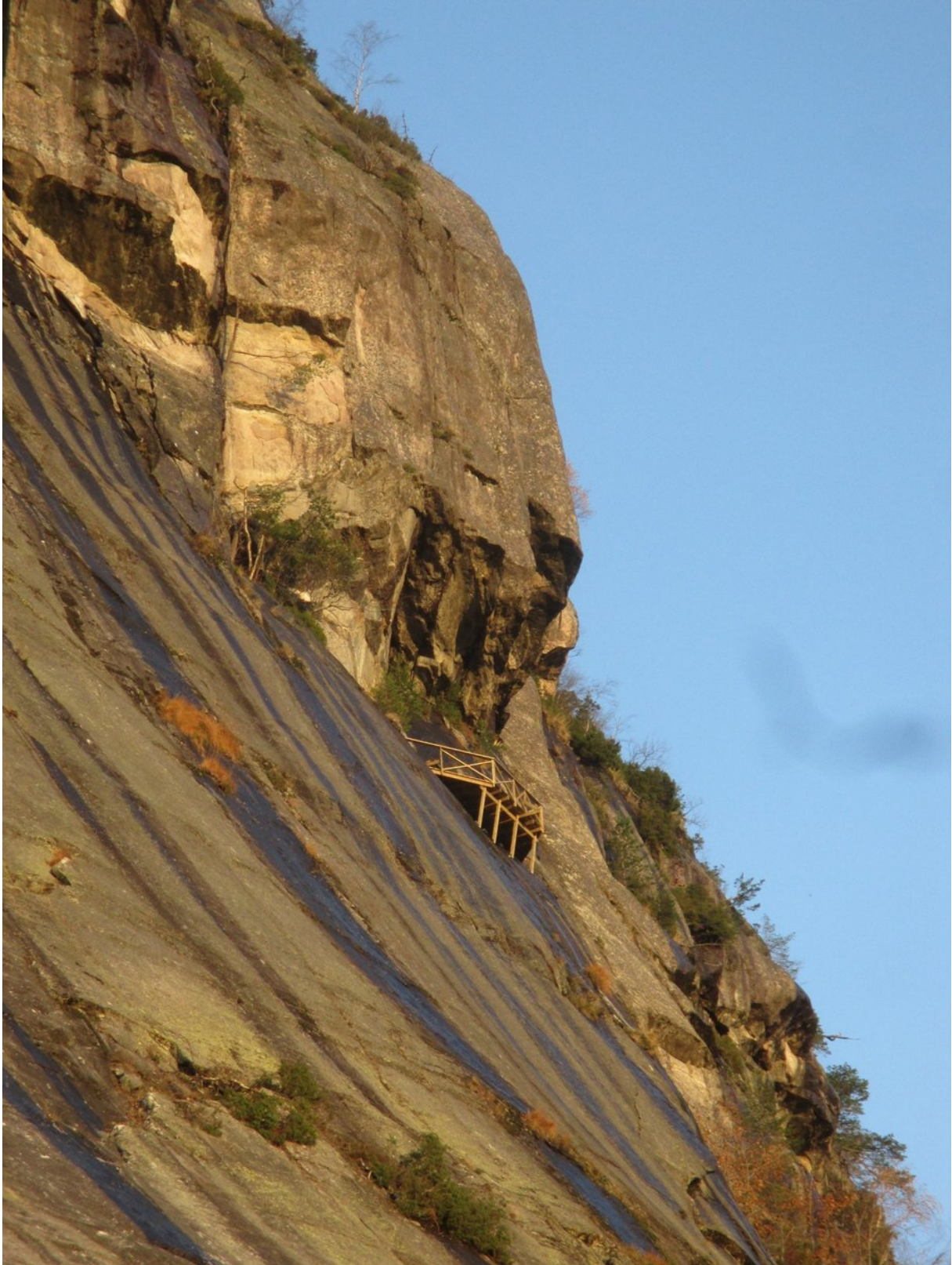
Bilde som viser oppført plattform før steinsprang, bilde er tatt høsten 2020.