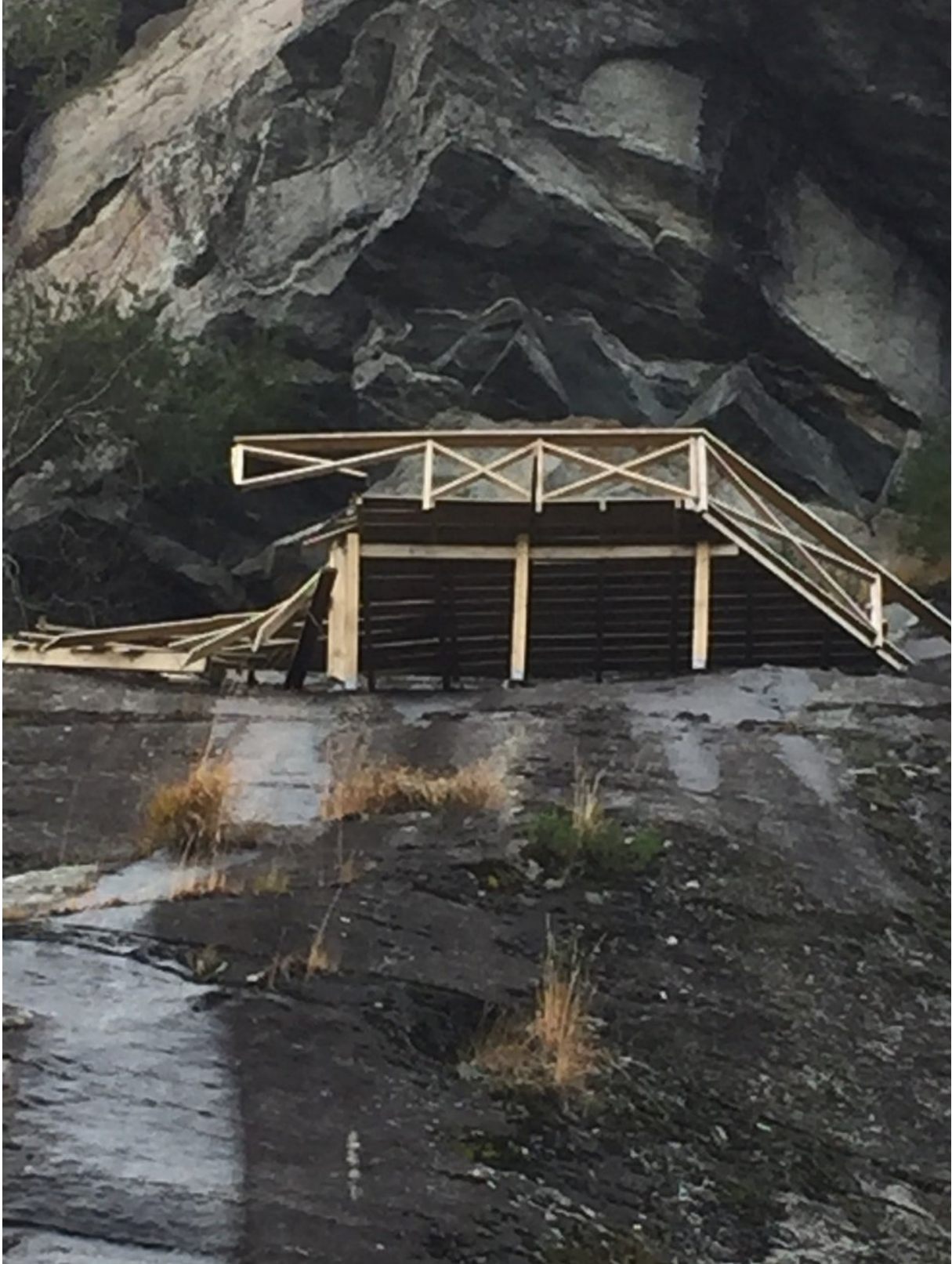
Bilde som viser oppført plattform etter steinsprang, bilde er tatt høsten 2021.