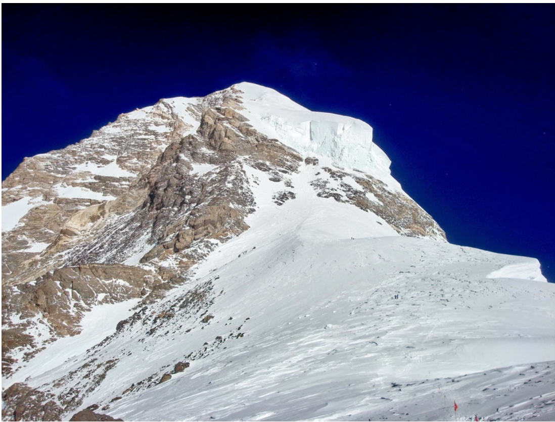
Toppen av K2 sett fra leir 4 på Abruzziryggen. Skulderen i forgrunnen.