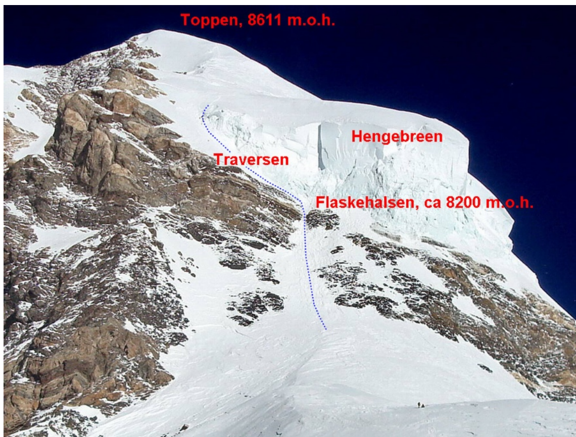
Flaskehalsen og traversen sett fra leir 4. Blå stipling viser hvor det ble lagt ut tau på toppdagen.