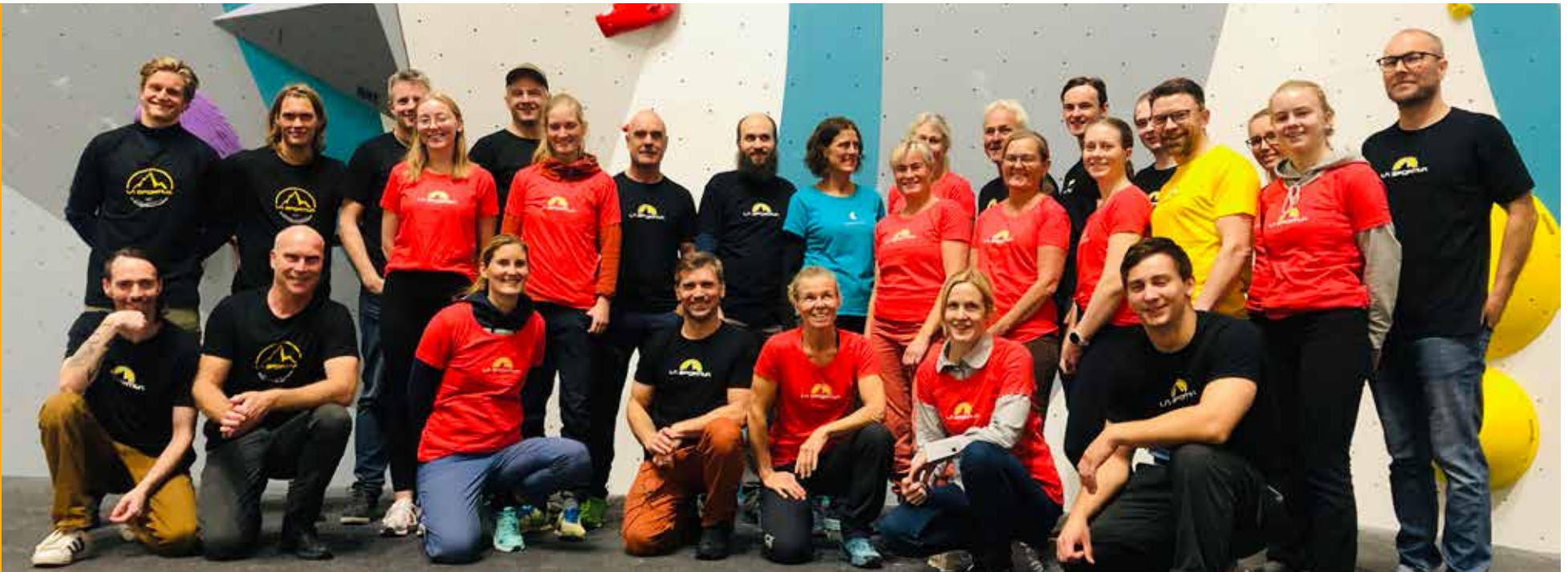
Frivillige på NC led i Kristiansand.

Oversikt over resultater for nasjonale og internasjonale konkurranser finner du i vedlegg 2.