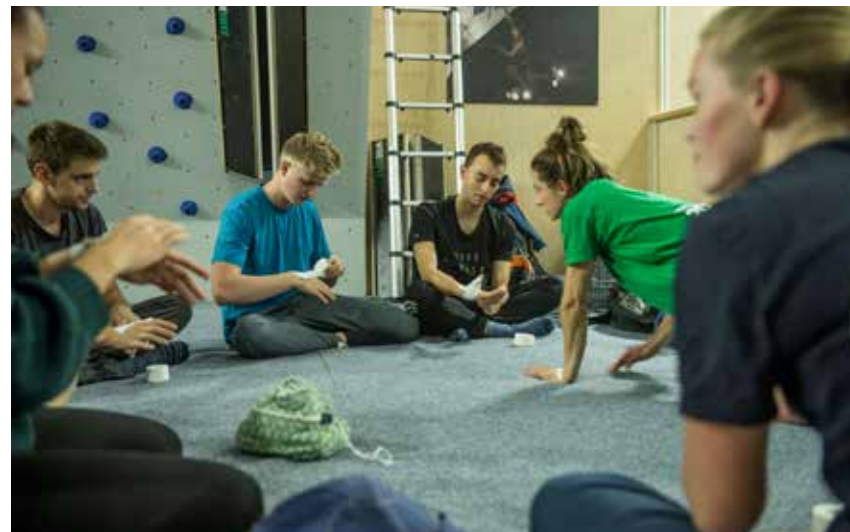
Mentorordning Bergen kk.

Noen av de planlagte Klatreleder inne-kursene ble gjennomført i 2021, men flere ble utsatt eller avlyst på grunn av pandemien. NKF vil ikke lenger sende ut kurslærere til å holde disse kursene, men gir heller støtte til klubber som har behov for å gjennomføre dette.