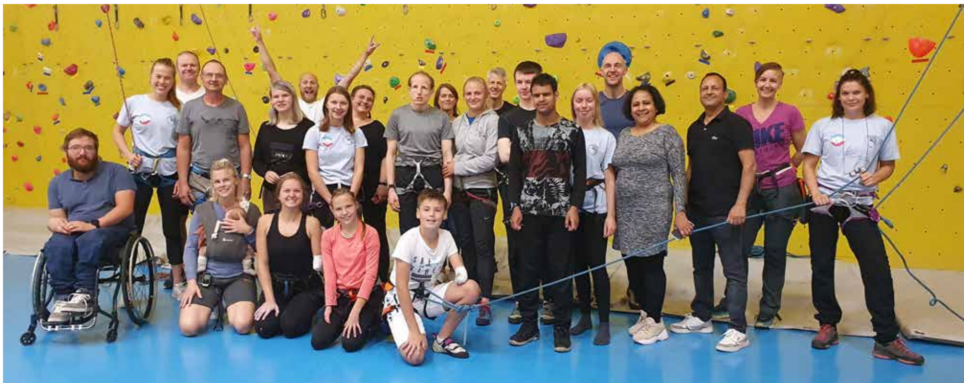
Breddesamling i Skien.

I september ble den første norgescup-konkurransen i paraklatring arrangert sammen med led i Tromsø. I november ble det andre NM i paraklatring og led arrangert i Bergen klatreklubb.