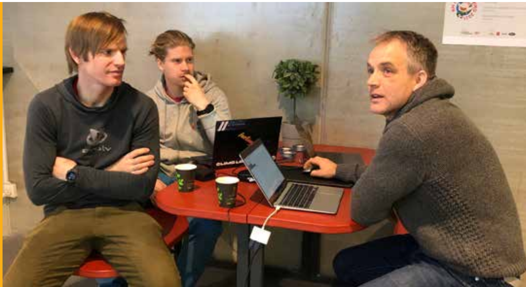
Arrangører på NM i led, speed og para i Bergen.

Historiens første norgescup i para ble arrangert i Tromsø samtidig med norgescup i led. Parautøvere og funksjonsfriske deltok på lik linje både i kvalifisering og finale. Det har ikke vært arrangert nasjonal konkurranse på Sørlandet siden 2016, og det var derfor svært gledelig at Christianssand klatreklubb var arrangør for årets andre norgescup i led. Begge norgescup-konkurransene ble flott gjennomført til tross for inngripende smitteverntiltak.