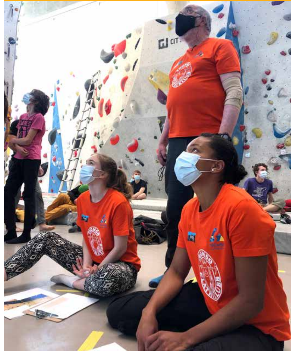
Frivillige dommere på NC i led og para i Tromsø.