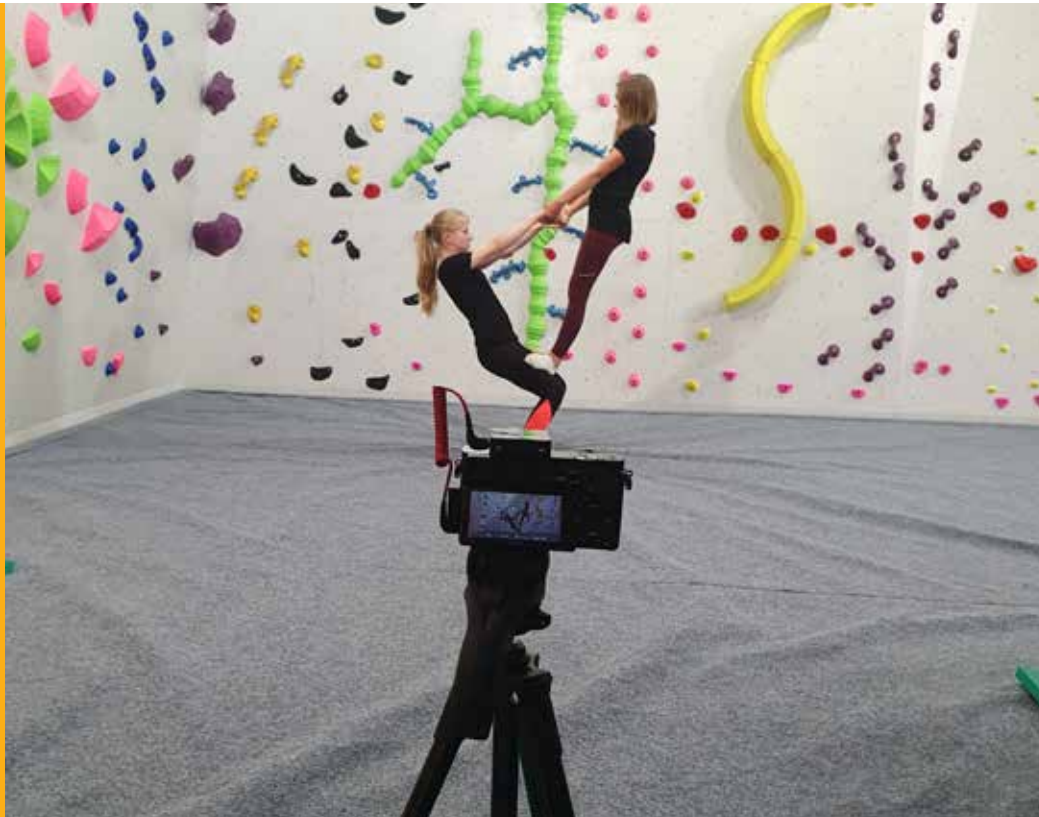
Filming til Klatrøkta.

NKF fikk i 2019 innvilget kr 3 250 000,- av Sparebankstiftelsen DNB til et toårig prosjekt med navnet Kompetanseløftet. Prosjektet ble avsluttet i august 2021. Målet med prosjektet er Bedre trenere – Bedre aktivitet – Bedre klatrere. Prosjektet