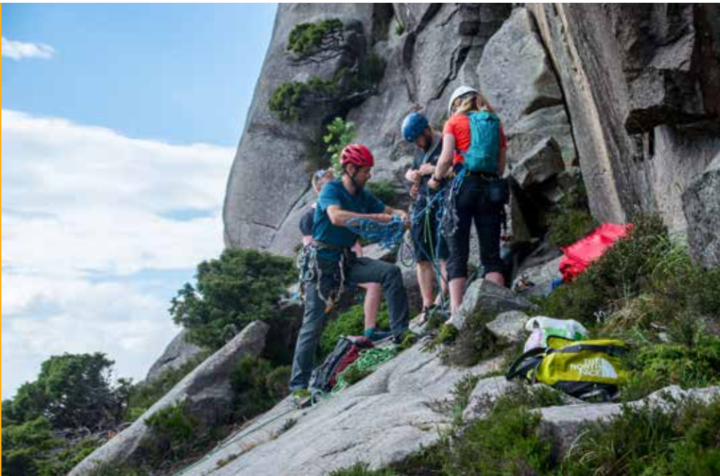
▲ Mentorordning Bergen kk. Mentorgjengen i Tromsø klatreklubb i sving. ►

På grunn av koronapandemien har også 2021 vært et år med reduserte muligheter til å gjennomføre aktivitet i klubbene. Vi har totalt mottatt 24 søknader på aktivitetstilskudd inne (til sammenligning var det 30 søknader i 2019). 13 av disse er gjennomført. Noen aktiviteter som var planlagt i 2020, ble gjennomført i 2021, så det har vært litt mer aktivitet enn foregående år.