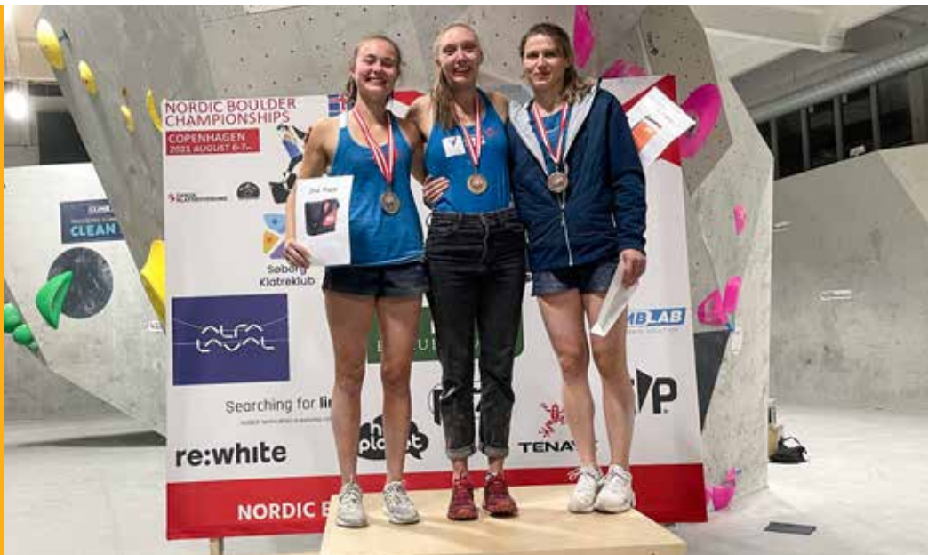
Gullpallen på Nordisk mesterskap buldring i København.

Ved inngangen til 2021 hadde vi alle forhåpninger om et normalt år etter 2020. Dessverre ble det ikke sånn. Forskjellige restriksjoner i samtlige land og en hard linje i Norge gjorde det mye vanskeligere å reise, konkurrere og holde samlinger. Flere arrangementer ble også avlyst i løpet av året. Forskjellige karanteneregler gjorde det også vanskelig for NKF å kunne ta ansvar for mindreårige på utenlandsreiser. Logistikken ble ikke lett, da vi var nødt til å ta hensyn til de forskjellige testkravene både før avreise, under oppholdet og før hjemreise.