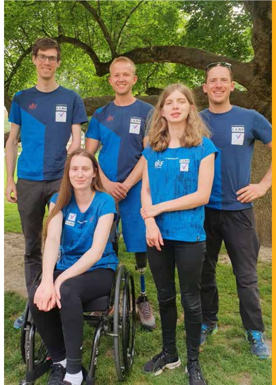
Parautøvere på landslaget.

I Nordisk stilte vi med hele 32 deltakere og tok 10 medaljer, herav 4 gull.