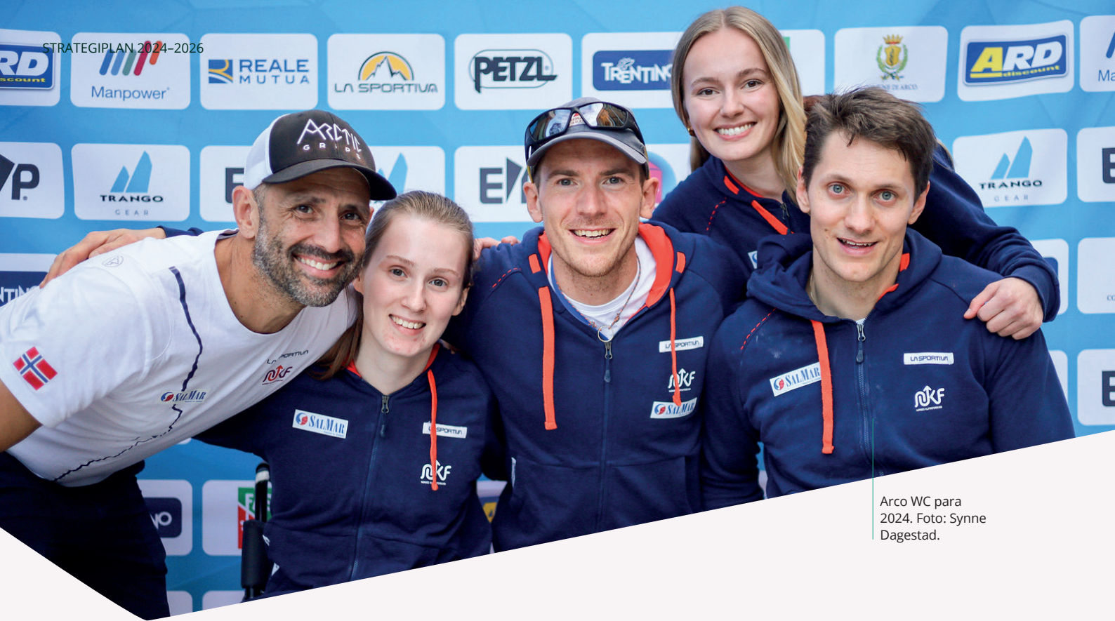
Arco WC para 2024.